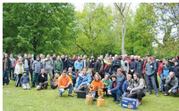
Für die diesjährigen Klettermeisterschaften muss ein neuer Standort gefunden werden, hier Mitglieder bei der Preisverleihung in Unna 2013.

In Bezug auf die diesjährigen Klettermeisterschaften gibt es leider schlechte Nachrichten, denn die Stadtverwaltung Neuwied am Rhein hat bedauerlicherweise kurzfristig die Zusage zurückgenommen. Das ISA-Chapter bemüht sich derzeit um einen Ersatzstandort. – sr/jvh/bo –